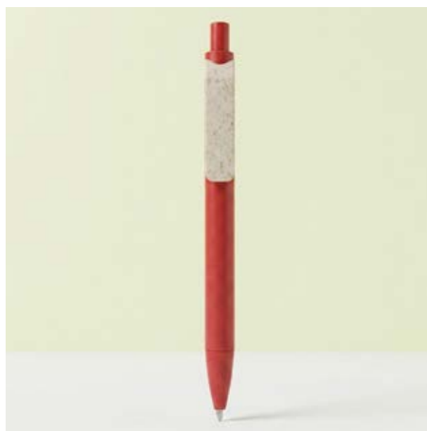
BOL 334 Bolígrafo Quinn