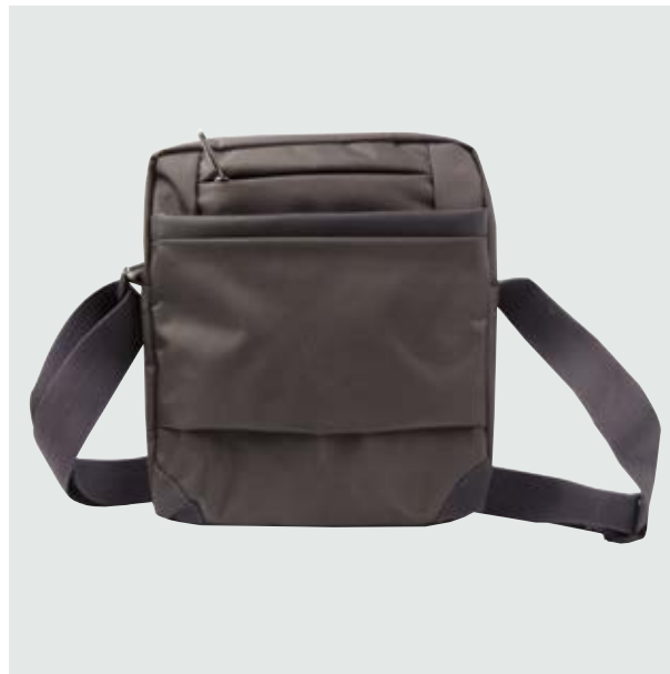
MAL 522 Bandolera Ronaldo ■

Material: Polyester Medida: 25 x 22.5 x 4.5 cm