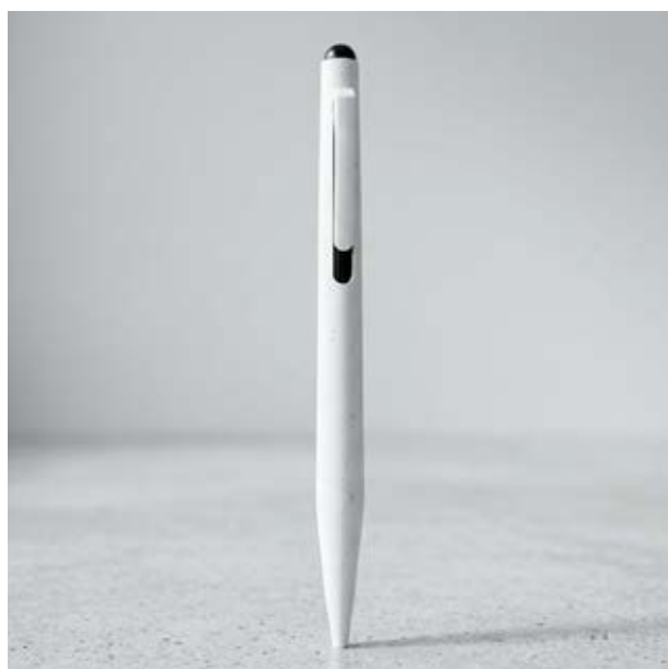
BOL 330 Bolígrafo Gibrán