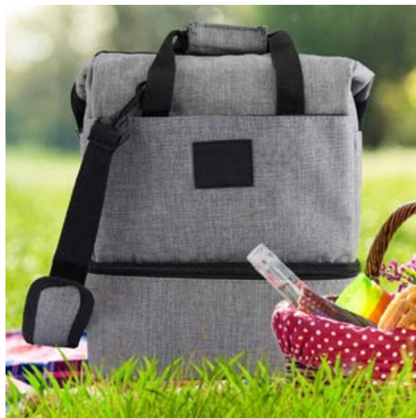
MAL 112 Lonchera Brady