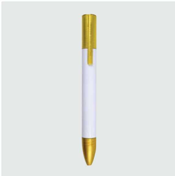
BOL 574 Bolígrafo Doré