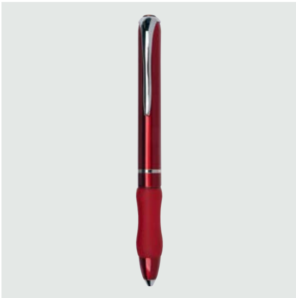
BOL 558 Bolígrafo Monet