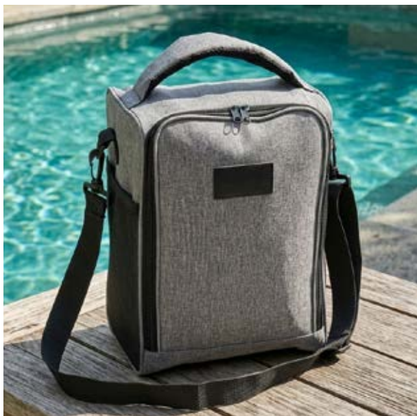
MAL 108 Lonchera Lombardi